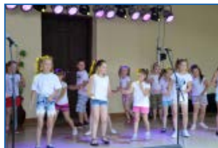
Zespół taneczny Angels i zespół wokalny Voice podczas występu