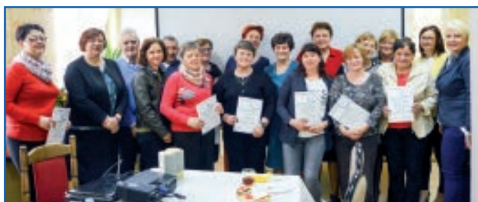
Uroczyste podsumowanie projektu

Realizatorem projektu jest Fundacja Rozwoju Społeczeństwa Informatycznego, a jego założenia są zgodne z Programem Rozwoju Bibliotek.