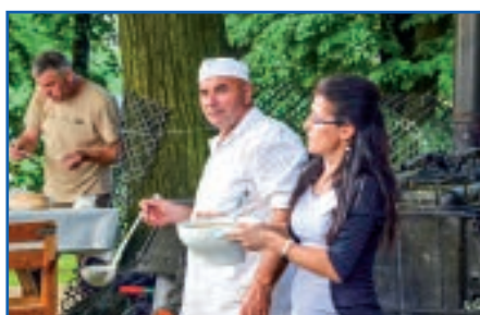
Nie mogło zabraknąć stołu wiejskiego i tradycyjnej grochówki