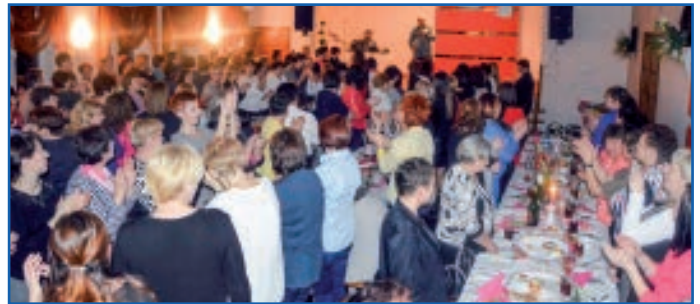
Zabawa przy muzyce disco polo

Składamy serdeczne podziękowania wszystkim, którzy przyczynili się do przygotowania uroczystości.