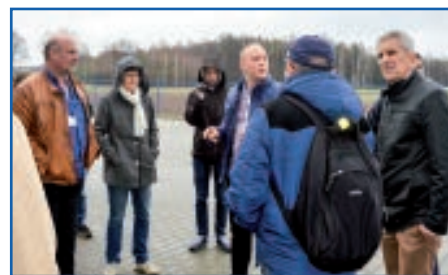
Wizyta w wytwórni pasz Golpasz w Podkonicach Dużych

Składamy serdeczne podziękowania wszystkim osobom, które przyczyniły się do sprawnego zorganizowania wizyty młodzieży holenderskiej w naszej gminie.