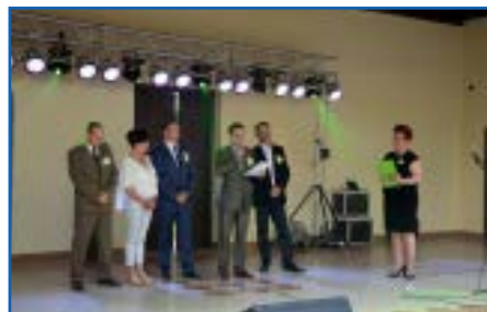
Prezentowanie komisji konkursowej i odczytanie regulaminu konkursu przez jej przewodniczącego

zmieniona: wszystkie reprezentacje wcześniej wzięły udział w losowaniu regionu kulinarnego i zobowiązały się do przygotowania potraw, związanych z daną kulturą i kuchnią. W poprzednich edycjach skupiano się na