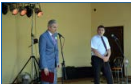
Powitanie gości przez wójta gminy i wicestarostę powiatu

zentujące potrawy kuchni kresowej, KGW Stanisławów Lipski – gmina Czerniewice, które przygotowało obiad i inne przysmaki dla zaproszonych gości (potrawy te nie podlegały ocenie komisji), KGW Brzustów – gmina Inowłódz, które serwowało kuchnię regionu śląskiego i Podhala, KGW Stokrotki z Emilianowa – gmina Lubochnia, prezentujące kuchnię regionu kujawskiego, KGW Kierzanki z Sadykierza – gmina Rzeszyca, które przygotowało potrawy kuchni podlaskiej, KGW Chorzęcin – gmina Tomaszów Maz., u których można było skosztować dań z kuchni Warmii i Mazur, KGW Czerwonka – gmina Żelechlinek, które częstowały daniami z kuchni Mazowsza i Kurpiów oraz zespół ludowy Łucy-Babki – gmina Ujazd, który przygotował potrawy z kuchni Wielkopolski. Z uczestnictwa w konkursie zrezygnowała gmina Rokiciny.