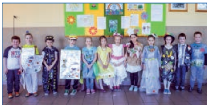
Pokaz mody ekologicznej

25 kwietnia br. z okazji Dnia Ziemi w Zespole Szkół i Przedszkola w Czerniewicach odbyło się spotkanie z uczniami klas I – III. Miało na celu poszerzenie wiedzy przyrodniczej uczniów, uwrażliwienie ich na zagrożenia ekologiczne współczesnego świata oraz kształtowanie potrzeby dbania o najbliższe otoczenie. Poszczególne klasy przygotowały piosenki ekologiczne i plakaty. Wspólnie odśpiewano hymn ekologiczny szkoły. Wesołym akcentem okazał się pokaz mody ekologicznej. Wykorzystano do tego celu kartony, butelki i torby z tworzyw sztucznych, czyli z odpadów, które nadają się do recyklingu (powtórnego wykorzystania). Uczniowie odgadywali zagadki, rozróżniali rośliny i rozwiązywali testy przyrodnicze oraz wybierali hasła, mówiące o zdrowym stylu życia. Obchody Dnia Ziemi dostarczyły uczestnikom miłych wrażeń i emocji.