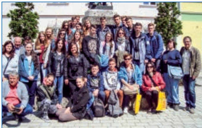
Uczestnicy wymiany w Rain

W ostatnim dniu pobytu wycieczka udała się do jednego z najstarszych miast niemieckich – Augsburga, gdzie zwiedzono m.in. miasteczko Fugerei. Kolejna wymiana uczniów już w przyszłym roku, tym razem uczniowie z Rain przyjadą do Czerniewic.