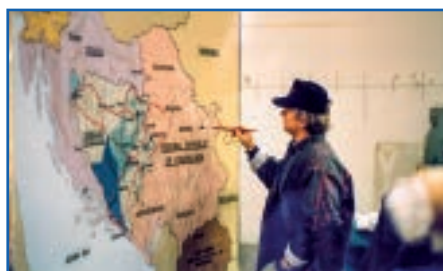
Mieczysław Lesiak na tle swoich prac graficznych w studio CBS w Nowym Jorku