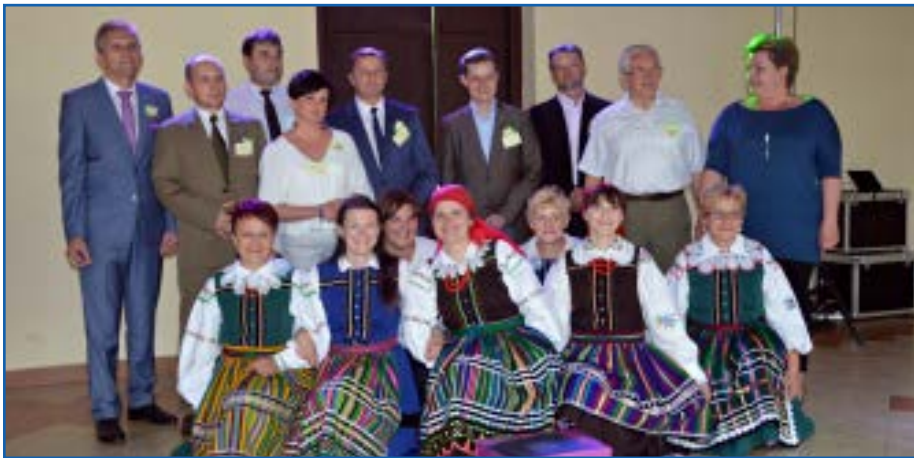
Zwycięskie KGW Stokrotki wraz z gospodarzami konkursu, wójtem gminy Lubochnia oraz komisją konkursową