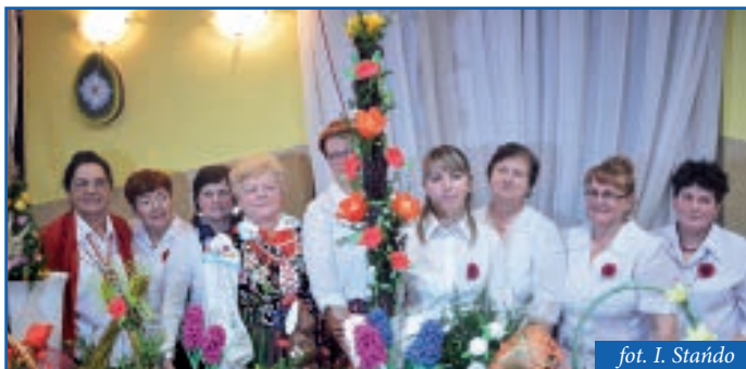
Przedstawicielki gminy Czerniewice i wykonana przez nich palma

6 marca 2016 roku w gminie Będków odbył się XIII Powiatowy Konkurs Palm i Pisanek Wielkanocnych. Konkurs daje młodym gospodyniom możliwość wykazania się talentem plastycznym i pomysłowością, a także promuje podtrzymywanie dawnych wielkanocnych tradycji. Gminę Czerniewice reprezentowało Koło Gospo-