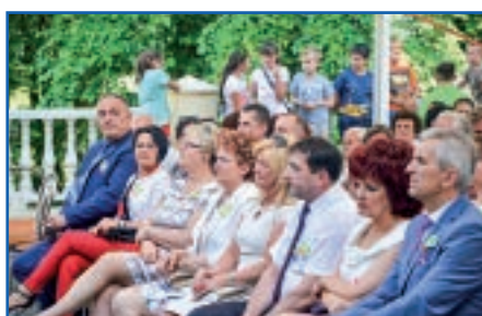
Publiczność konkursu zaabsorbowana występami artystycznymi