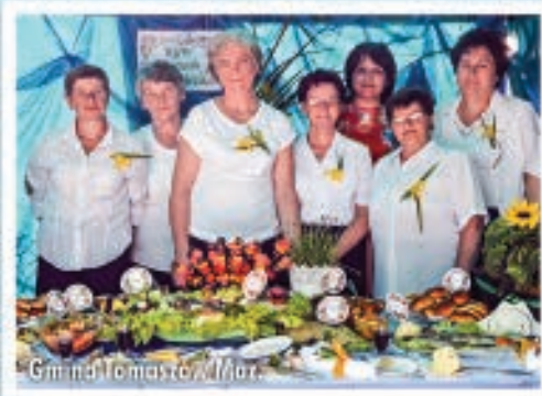
Gmina Tomaszów Maz.