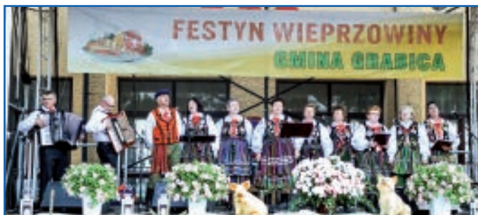
Czerniewiczanie podczas występu

22 maja br. w gminie Grabica w powiecie piotrkowskim odbył się I Festyn Wieprzowiny. Celem inicjatywy jest promocja produkcji zwierzęcej, szczególnie trzody chlewnej, z której gmina Grabica słynie. Podczas festynu było wiele atrakcji. Jedną z nich był występ zespołu Czerniewiczanie. Grupa, w charakterystycznych dla naszego regionu strojach rawsko-opoczyńskich, wykonała kilka utworów o tematyce ludowej. Choć piosenki swoje lata mają, to ich przesłanie jest nadal aktualne. Publiczność nagrodziła delegację z Czerniewic gromkimi brawami. Później przyszedł czas na degustację wieprzowiny w każdej możliwej postaci, a gospodarze byli bardzo gościnni.