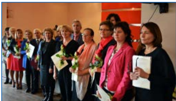
Nagrodzeni nauczyciele z dyrektorami szkół, wójtem i przewodniczącą Rady Gminy Czarniewice

13 października 2016 roku świętowali pracownicy oświaty, na co dzień dbający o prawidłowe funkcjonowanie placówek szkolnych. Obchody tego ważnego w kalendarzu szkolnym święta odbyły się w świetlicy wiejskiej