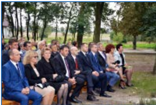
Zaproszeni goście w Lipiu