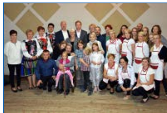
Rodzina Luboradzkich i KGW Strzemeszna

W związku z uroczystościami mieszkańcy Strzemeszyny odnowili kapliczkę z 1922 roku,