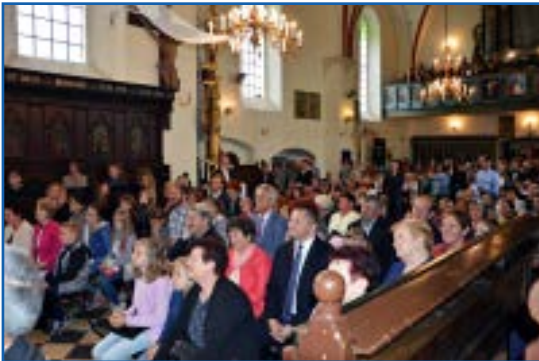
Uroczystości w kościele w Krzemienicy

18 września 2016 roku odbyła się uroczystość pożegnania lata pod hasłem „Przed wszystkim historia”. Powodów do