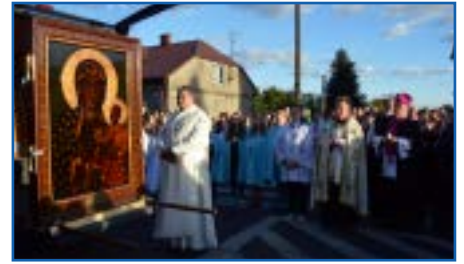
Powitanie ikony Matki Bożej Częstochowskiej w parafii Czerniewice