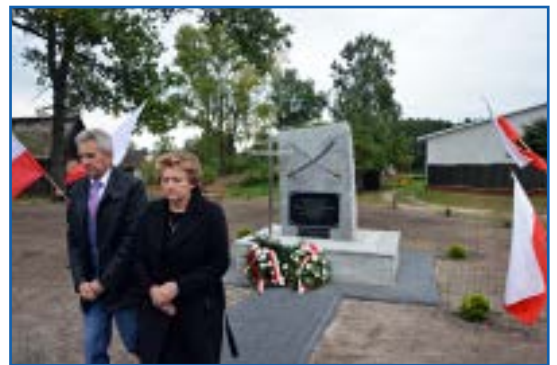
Poświęcenie kapliczki w Strzemieszynie i złożenie kwiatów

zy serwowano tradycyjną grochówkę i swojskie wyroby wędliniarskie ze stołu wiejskiego.