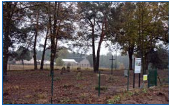
Cmentarz przez rozpoczęciem prac i po ich zakończeniu