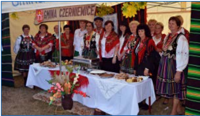
Reprezentacja gminy Czerniewice przy swoim stoisku

1 października 2016 roku w Białaczowie w powiecie opoczyńskim członkinie kół gospodyń wiejskich z powiatów piotrkowskiego, tomaszowskiego i opoczyńskiego świętowały 150-lecie swojej organizacji. Pierwsze koło gospodyń – wówczas jako Towarzystwo Gospodyń – powstało już w 1866 roku w Piasecznie koło Gniewa na Pomorzu. Natomiast pierwsze o nazwie KGW, obowiązującej do dziś,