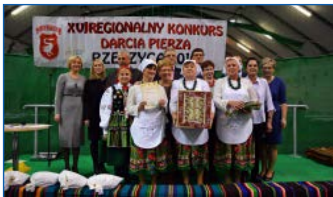
Przedstawicielki KGW Studzianki podczas odbioru nagrody