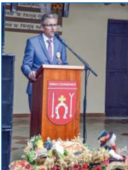
Powitanie gości przez wójta

Zaproszeni goście i występujący na scenie artyści mogli skorzystać z gościńca dożynkowego, gdzie serwowano obiad. Dla pozostałych uczestników imprezy przygotowano poczęstunek: chleb ze smalcem i ogórkiem kiszonym, tradycyjne wyroby wędliniarskie, a także grochówkę z kuchni polowej. Nie zabrakło również innych smakołyków stołu wiejskiego... Zapraszały ogródki piwne, a w ich pobliżu stoiska z grillowaną kielbaską, karczkiem i szaszłykami. Na najmlod-