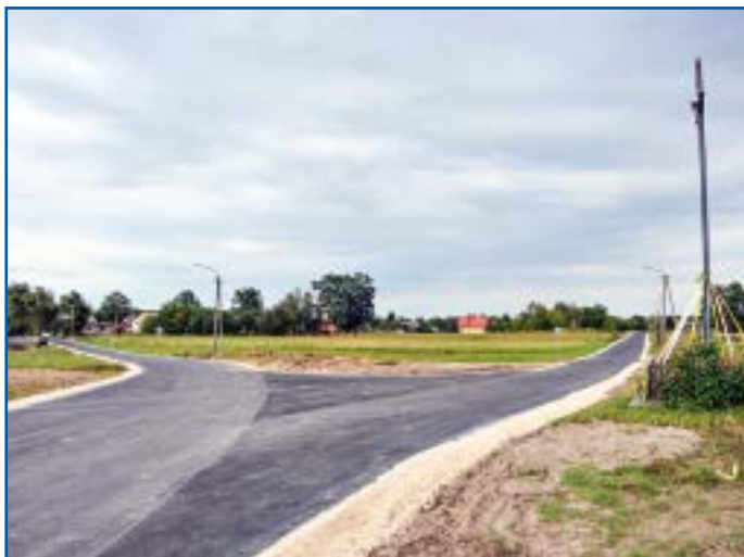
Nowa droga w Strzemesznie

i wzmocniono pobocza gruntowe kruszywem łamanym.