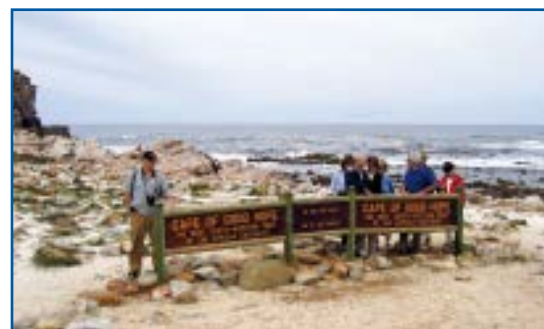
Na Przylądku Dobrej Nadziei.