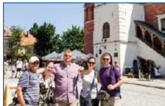
Z dziećmi w Sandomierzu.

Minęło dwadzieścia parę lat do następnych podróży, najpierw był to wyjazd z zespołem muzycznym do czterech krajów skandynawskich, później Stany Zjednoczone. Przyjazd do Polski w 1990 roku z całą rodziną po 16 latach nieobecności