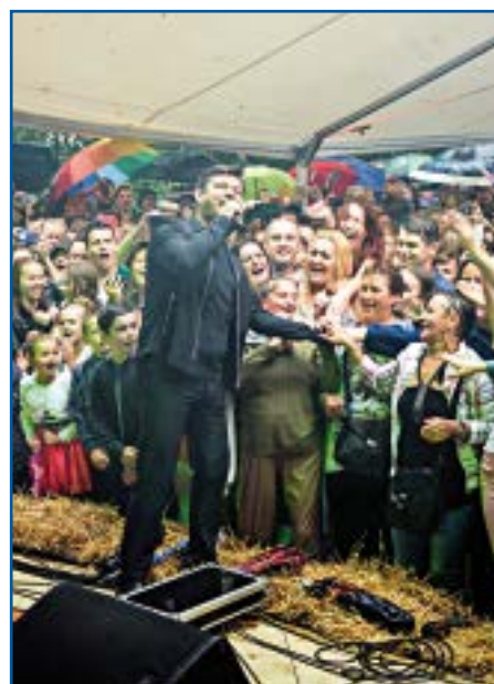
Zenon Martyniuk z zespołu Akcent wśród uczestników koncertu