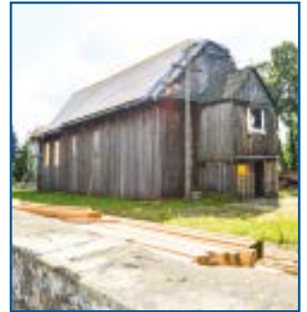
Wymiana pokrycia dachowego