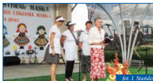
KGW Annów w Lubochni

cheński Festiwal Masła. W konkursie rywalizowały ze sobą przedstawicielki gmin z powiatu tomaszowskiego. Gminę Czerniewice reprezentowało KGW z Annowa. Wykonane masło oceniane było według następujących kryteriów: czas wykonania, wygląd masła, jego smak, estetyka, oryginalność podania.