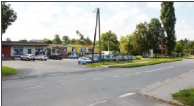
Obecny widok na centrum Czerniewic

koniec sierpnia br. zakończono prace, związane z przygotowaniem dokumentacji. W ramach planowanej inwestycji wykonane zostaną: przebudowy zjazdów publicznych z ulicy Mazowieckiej, przebudowa chodnika w ciągu drogi powiatowej, budowa placu manewrowego i zatoki autobusowej, zapewniającej obsługę komunikacyjną oraz budowa wiaty przystankowej.