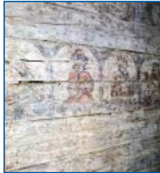
Fragment odsłoniętych w prezbiterium polichromii

wymianę dachu, wzmocnienie fundamentów, skucie tynków wewnątrz i zabezpieczenie znajdujących się pod nimi polichromii. Szacowany koszt prac wyniesie blisko 400 000 zł. Prace zostaną zakończone w październiku br.