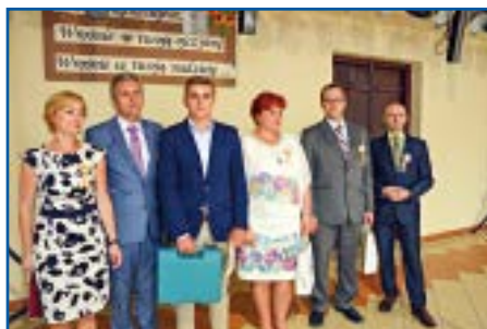
Zwycięzca konkursu „Najładniejsza posesja w gminie Czerniewice” w 2016 roku w towarzystwie: wójta, starostów dożynek (również uczestników konkursu), kierownika i pracownika placówki KRUS w Tomaszowie Maz.