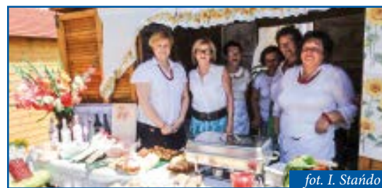
KGW Podkonice Duże przy swoim stoisku

Niedługo potem, od 13 do 19 czerwca br., w Tomaszowie Mazowieckim zorganizowano wydarzenie pod nazwą Tydzień Antoniański. W odróżnieniu do imprez w Lubochni i Żelechlinku, które na stałe