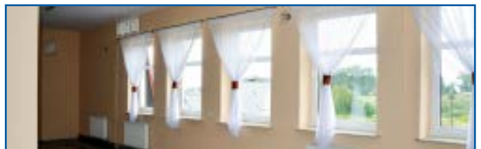
Odświeżona sala konsumpcyjna

wymianę nieszczelnych drewnianych okien w sali konsumpcyjnej, na klatce schodowej i w korytarzu łączącym kuchnię z salą taneczną, a także malowanie ww. pomieszczeń wraz z magazynkiem.