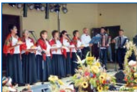
Zespół Czerniewiczanie wykonuje pieśń „Niesiemy plon”, która rozpoczyna świąteczną część obrzędu dożynkowego