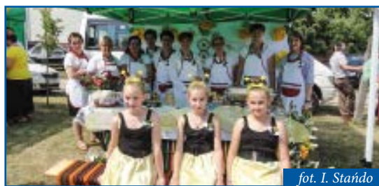
KGW Strzemeszna podczas miodobrania

które przygotowały mnóstwo smakołyków z dodatkiem miodu. Na stoiskach pojawiły się m.in. nadziewany kalafior oraz królik na zielonej łączce z marchewką. Tym razem naszą gminę reprezentowało KGW